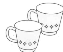
①950 yen ②980 yen